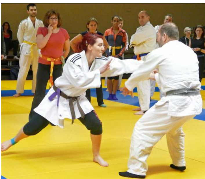
Les démonstrations se déroulent dans la bonne humeur.

Y ALLER Vendredi 9 mars, à 19 h 30, au dojo à Ungersheim.