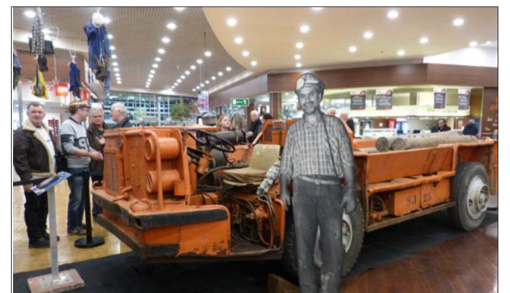
Parmi les machines exposées, l'impressionnant Scout-Car Joy qui servait au transport du personnel et de matériel au fond de la mine.

Une exposition inédite dans les allées de la galerie de l'Espace Witty présente, jusqu'au 10 mars, le passé minier de l'Alsace.